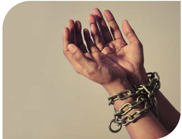
Pedro fue encarcelado.

Después de la muerte del Señor a causa del temor se escondió junto con los demás apóstoles, pero después de experimentar una realidad con el Cristo resucitado y haber recibido el bautismo del Espíritu Santo su vida no fue la misma. Comenzó a predicar el evangelio con valentía y ya no le importó ser llevado a la cárcel ni ser azotado (Hechos 2:14 LBLA). Después de haber pasado el proceso de rendirse, Pedro logró que otros se convirtieran y arrepintieran, trayendo el anhelado crecimiento a la Iglesia. Ahora veamos las veces que